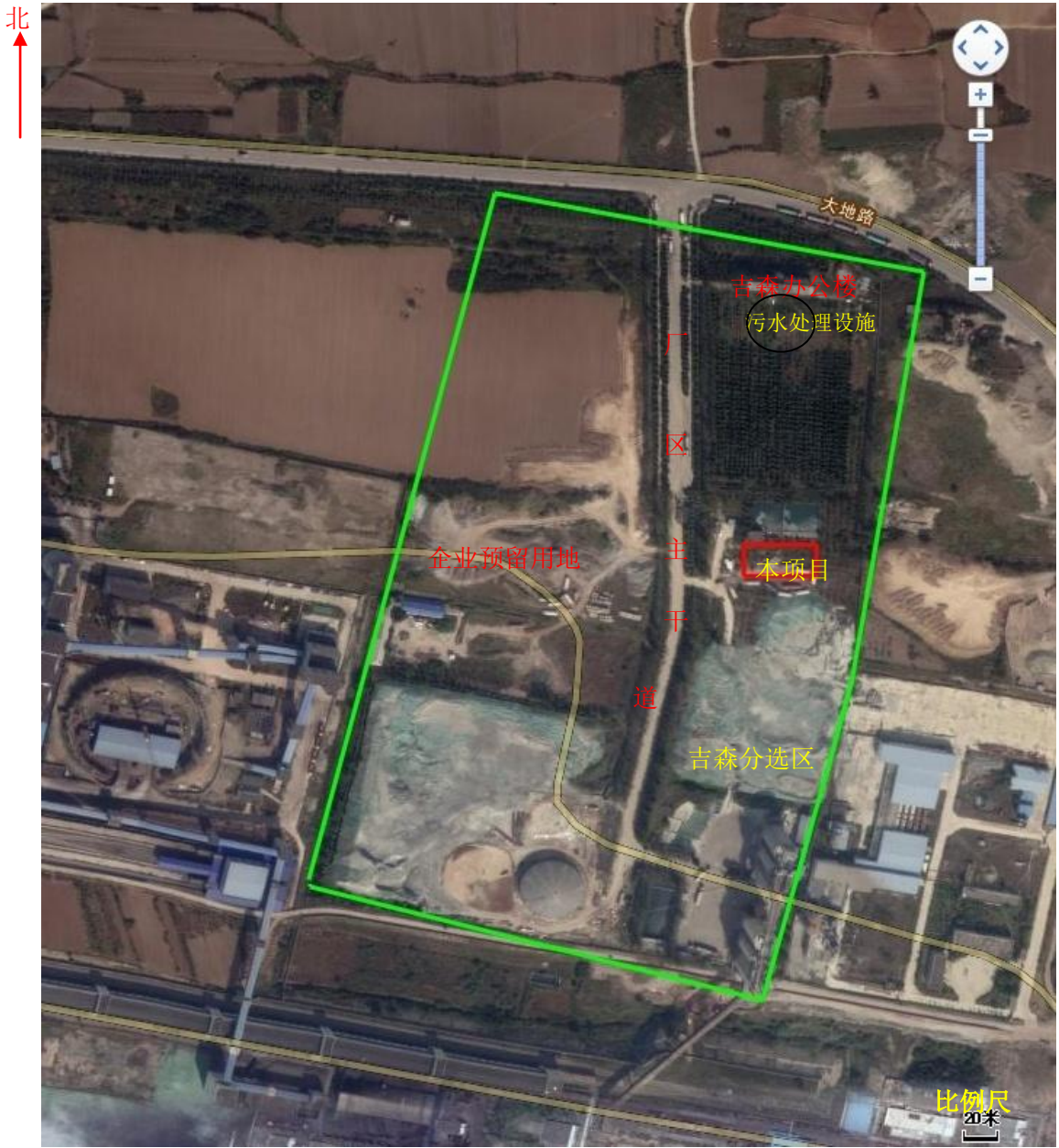
附图 3 项目在厂区位置图