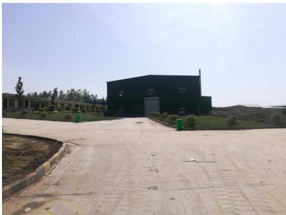
厂区现状地面硬化、绿化及生活垃圾收集桶