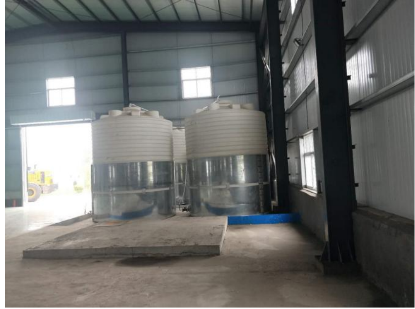
储罐围堰及事故池