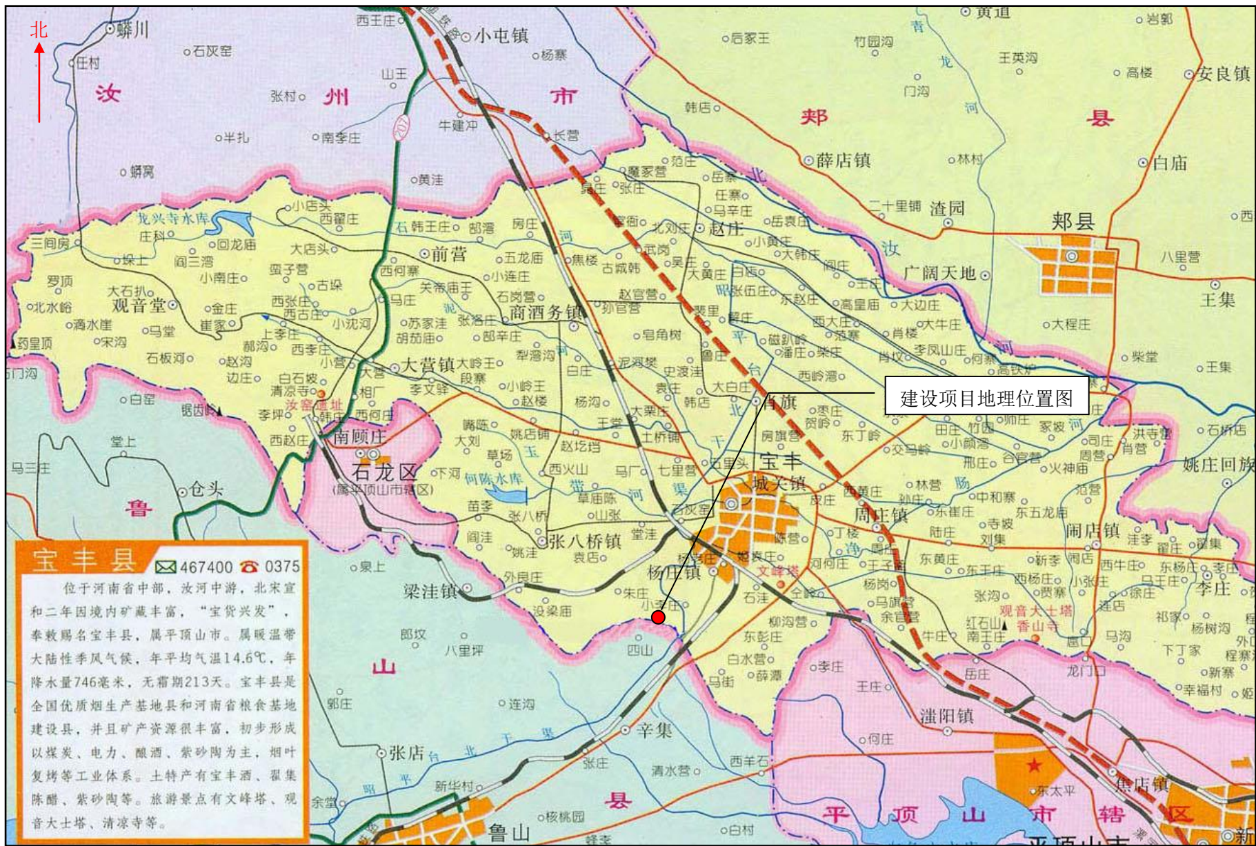
附图1 本项目所在地理位置图