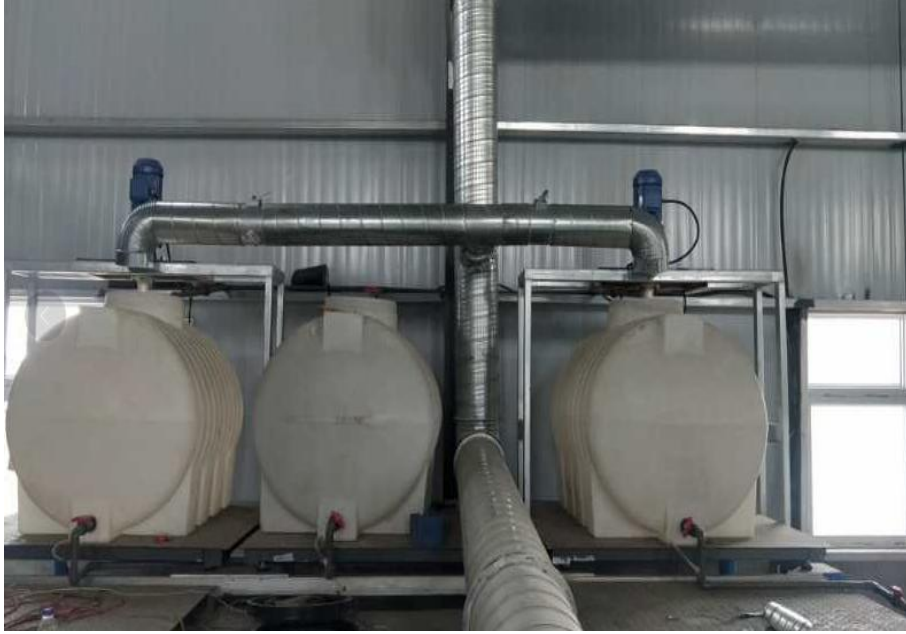
计量罐上方的收集管道