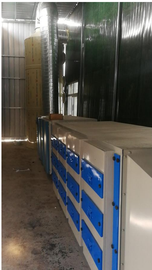
水喷淋+光氧催化+活性炭